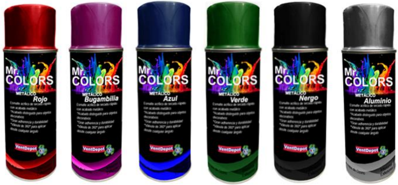
MXAER-001 MXAER-002 MXAER-003 MXAER-004 MXAER-005 MXAER-006

(El color de las tapas de las latas puede no ser el color exacto, no daña el color verdadero de la pintura basarse en las paginas 3-5).