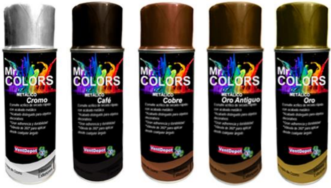
MXAER-007 MXAER-008 MXAER-009 MXAER-010 MXAER-011