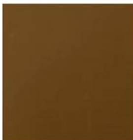
Oro Antigo MXAER-010